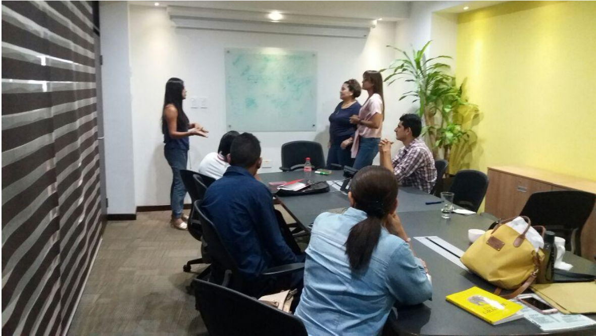
Curso de oratoria: El arte de hablar en público. Técnicas actualizadas basadas en ejercicios dinámicos.